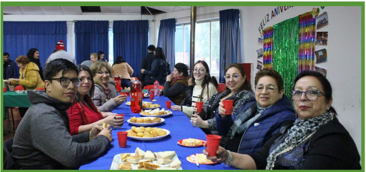
Asistentes al III aniversario del Programa Quiero Mi Barrio Puente Ñuble.